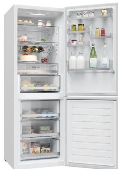
Fiche produit provisoire